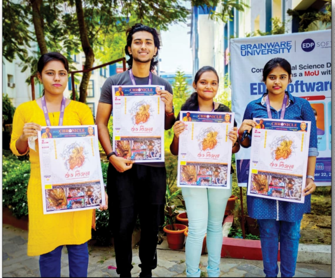
First semester students of Media Science and Journalism with thier first copy of msj

কোন সমাজ কখনোই তাদের উন্নতির কোন সমাজ কথনোহ তালের তমাতার দাবি করতে পারে না সমাজ মানুষ এটা দেখছেন। পচিমবঙ্গের সমাজ শুভবুদ্ধি সম্পন্ন সমাজ সচেতন, শিক্ষিত মানুষ এবং থারা নিজেদেরকে বুদ্ধিজীবী মনে করেন তারা এসে আমাদের পাশে দাঁডান। পরিস্থিতিটা যে জায়গায় দাঁড়িয়েছে তাতে আমার আপনার সন্তান কার কাছে পড়বে, কোথায় গিয়ে পড়বে , এই প্রশ্ন কিন্তু থেকেই যাছে । অবিলমে আপনারা সোচ্চার হয়ে প্রতিবাদ করুন এবং আমাদের পাশে দাঁড়ান। এই দুর্নীতির প্রতিবাদ করুন শিক্ষাকে বাঁচান। শিক্ষার মান উল্লয়ন কে বাঁচান মূল্যবোধ ফিরিয়ে আনুন। শিক্ষক যদি সঠিকভাবে বিদ্যালয়ে যেতে না পারে শিক্ষার মানের কিন্তু উন্নয়ন হবে না। নইলে কিন্তু ভবিষ্যৎ ধ্বংস হয়ে যাবে। কোন সমাজ বা দেশকে ভাঙতে হলে তার প্রথম কাজ হচ্ছে শিক্ষাব্যবস্থা কে ভেঙ্কে দেওয়া আর সেই কাজ কিন্তু শুরু হয়ে গেছে। আমাদের সকলের তরফ থেকে ধরনা মঞ্জের থেকে আপনাদেরকে আবেদন জানাই ,পশ্চিমবঙ্গের সমস্ত মানুষজন আম পাশে আসুন আপনাদের আশাতেই আমরা বসে আছি।